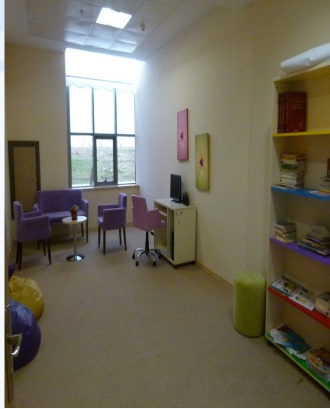
Ergen görüşme odası